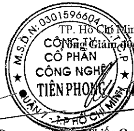
Lâm Thiệu Quân